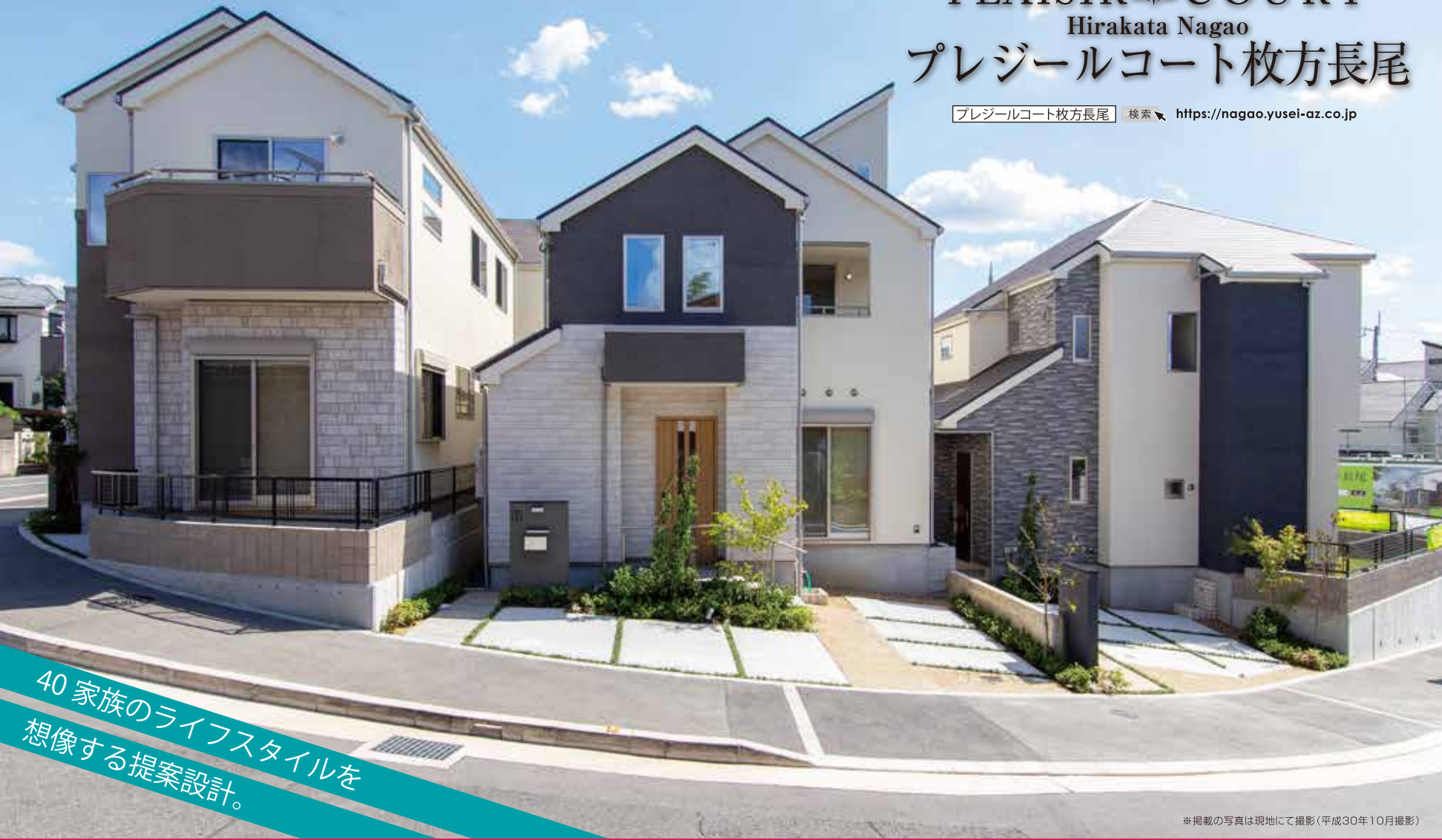
※掲載の写真は現地にて撮影(平成30年10月撮影)

プレジールコート枚方長尾 検索 https://nagao.yusei-az.co.jp